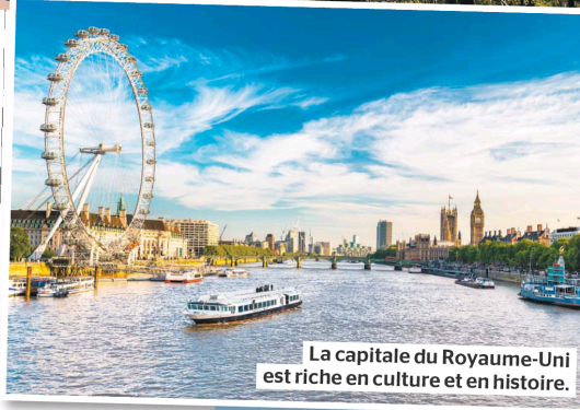
La capitale du Royaume-Uni est riche en culture et en histoire.