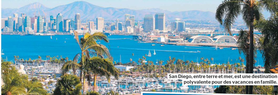
San Diego, entre terre et mer, est une destination polyvalente pour des vacances en famille.

Choisir une destination voyage dans laquelle grands-parents, parents, oncles, tantes et enfants pourront trouver leur bonheur : on croit à tort que seul Walt Disney World conviendra. S'il est vrai que les parcs thématiques de cet endroit arrivent au premier rang des vacances familiales, il existe d'autres possibilités. Voici cinq suggestions.