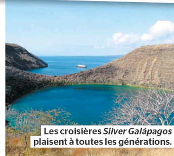
Les croisières Silver Galápagos plaisent à toutes les générations.